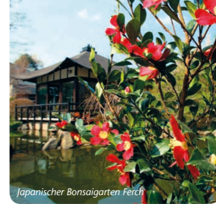
Japanischer Bonsaigarten Ferch

* Die Parks mit den Nummern 1 2 3 6 10 werden von der Stiftung Preussische Schlösser und Gärten Berlin-Brandenburg (SPSG) verwaltet: PF 601462 · 14414 Potsdam Tel. 0331 9694-0 · www.spsg.de