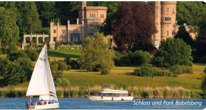
Schloss und Park Babelsberg

Eine Bootstour über die Havel lässt sich hervorragend mit dem Besuch von romantischen Park- und Schlossanlagen, blühenden Landschaftsgärten, asiatischer Gartenkunst oder informativen Kräutergärten verbinden.