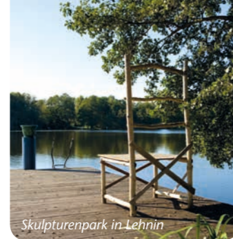
Skulpturenpark in Lehnin